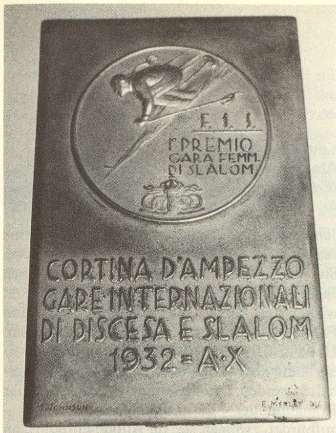
Eine bleibende Erinnerung an eine Siegesfahrt