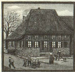
Kleine Welt in bunten Bildern Naïve Malerei von Elisabeth Hofstettler und Texte von Hermann Burger