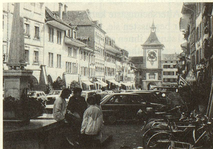
Blick in eine der malerischen mittelalterlichen Strassen von Murten.

«Murten ist ein interessantes Städtchen mit seinen vielen Gässchen und Winkeln. Man kann nach Herzenslust «lädele» und an schattigen Plätzchen Kaffee trinken. Am Samstagvormittag findet ein schöner «Märt» vor dem Berner Tor statt. In wenigen Minuten ist man am Murtensee, auch sonst hat es prächtige Spazierwege. Bei Ausflügen haben wir täglich Schönes erlebt, die schmucken Bauernhäuser waren eine richtige