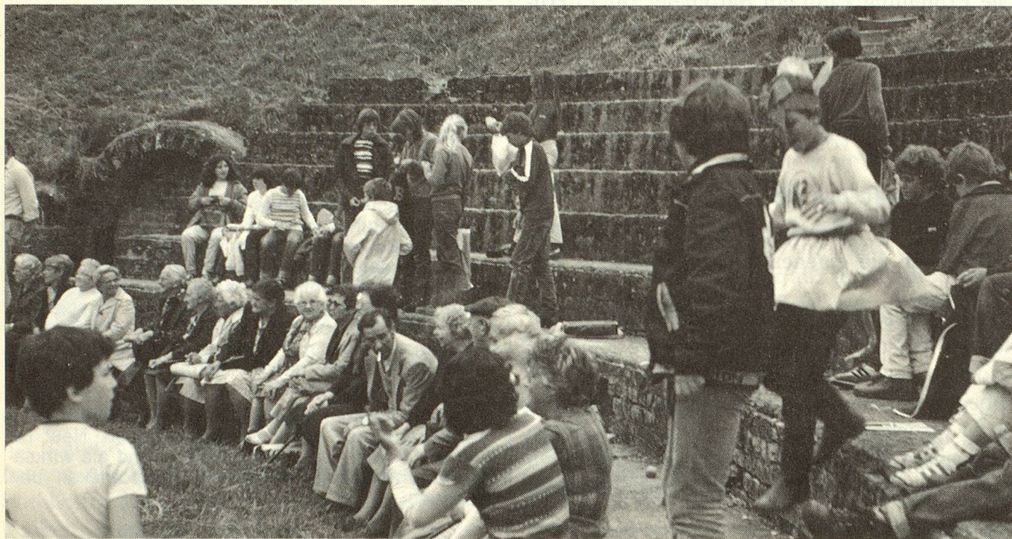
Die Wetziker Sechstklässler als «Fremdenführer» der Senioren im Amphitheater von Avenches.