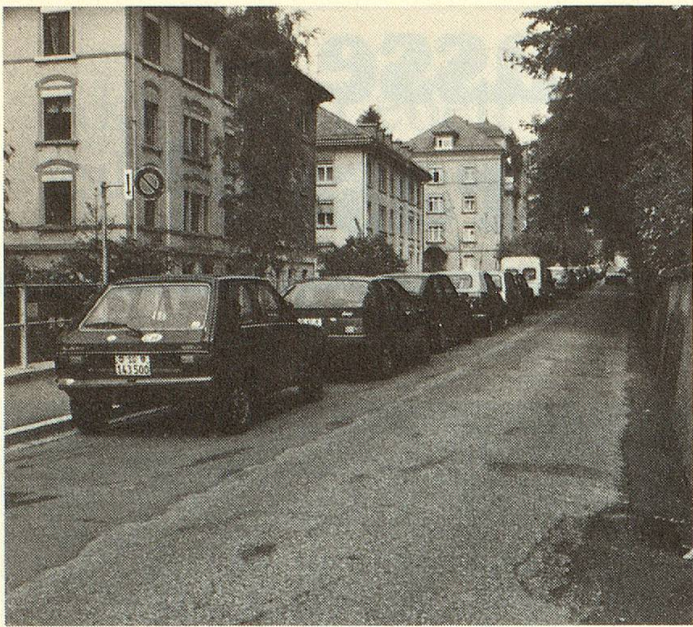
Neben den parkierten Autos hat in einer normalen Strasse nur der Durchgangsverkehr Platz.