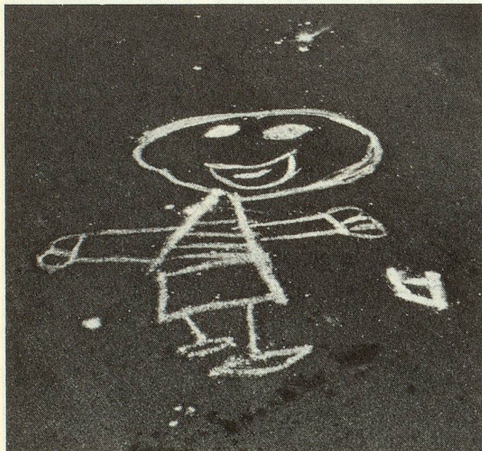
Punkt, Punkt, Komma, Strich, fertig ist das Angesicht, das Auto überfährt mich nicht!