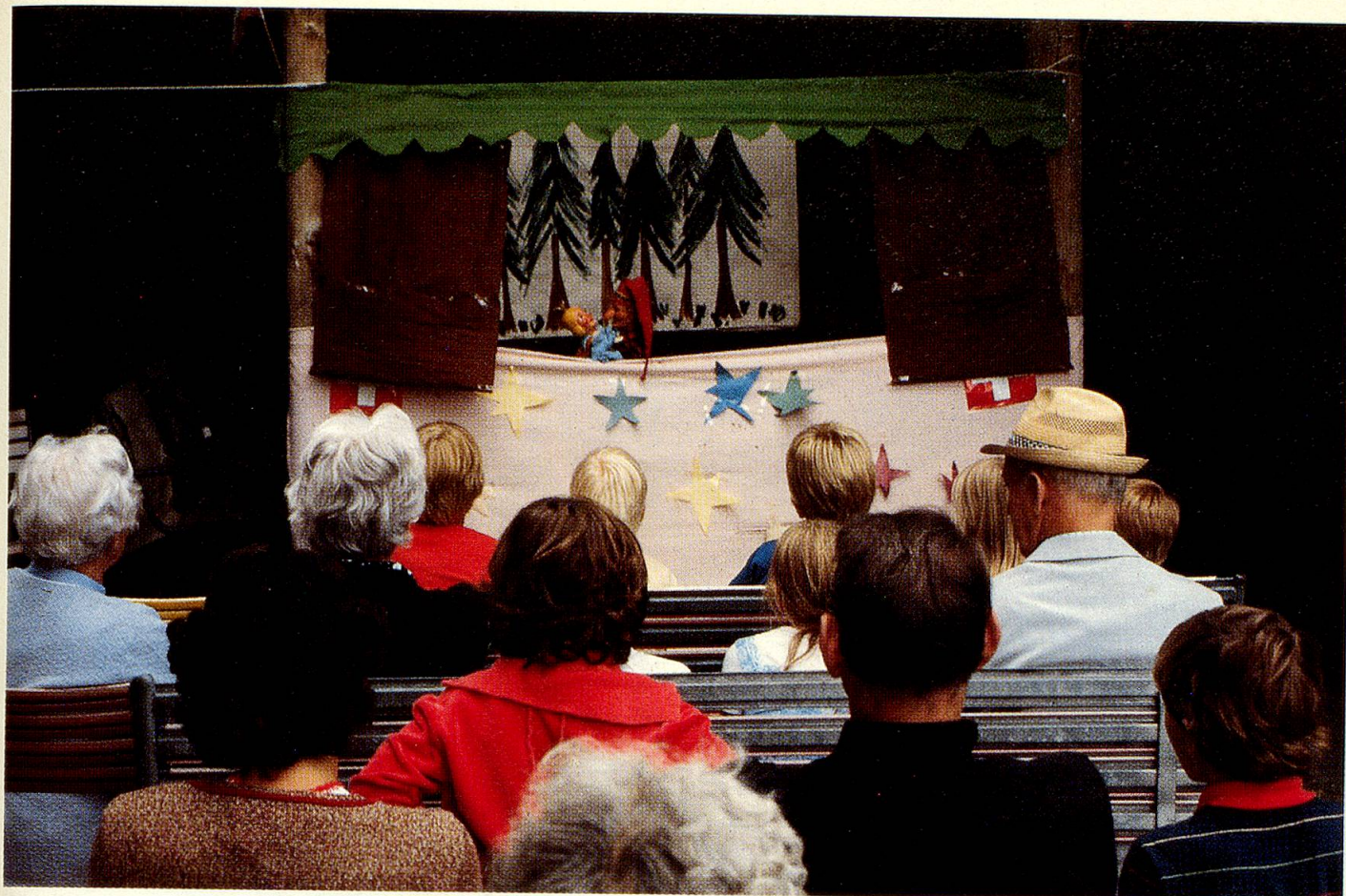
Oben: Abends sitzen alle entspannt vor dem improvisierten Kasperltheater. Unten: Temporeiche Polonaise von jung und alt.