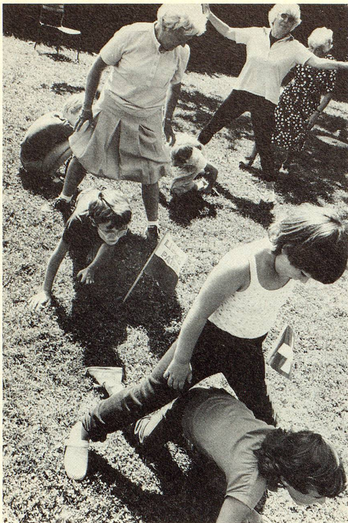
Kriech- und Streckübungen lockern die Glieder von Jungen und Alten.

Nebenstehend: Bei einem Waldspaziergang klettern alt und jung über Stämme und Wurzeln.