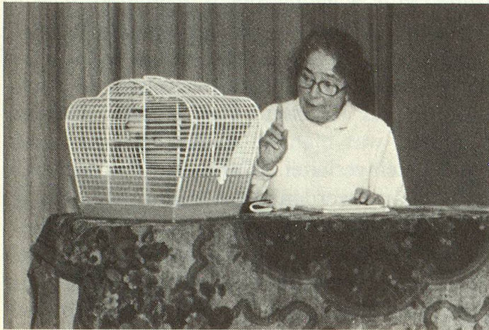
Die Senioren Bühne Biel spielt ohne Bühnenbild und nur mit den notwendigsten Requisiten.

In Schaffhausen steht Pro Senectute finanziell für die theaterspielenden Senioren ein, Biel hingegen kommt ohne jede Unterstützung von Pro Senectute aus. Die bescheidenen Mitglieder der Bieler Senioren Bühne errangen sich überhaupt besondere Achtung und Anerkennung: In Biel sind Arbeitslosenprobleme vordergründig, deswegen möchte man auf jegliche Zuwendungen verzichten. Um zu sparen, spielt man ohne Kulissen, was der Phantasie der Zuschauer nur förderlich ist und die Schauspieler zu Konzentration und intensivem Zusammenspiel zwingt. In Altersheimen spielt die Gruppe umsonst, von anderen Besuchern wird die bescheidene Eintrittsgebühr von fünf Franken erhoben.