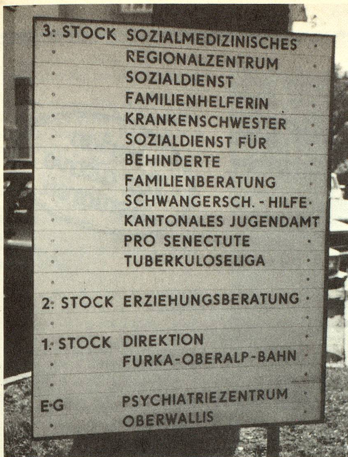
Das Sozialmedizinische Regionalzentrum in Brig erlaubt eine gute Koordination der zahlreichen Stellen.

kann man bei solchen Distanzen die Betagten ja nicht einfach bestellen. Ihre Fahrten gelten aber nicht bloss jenen unzähligen Einzelpersonen, denen sie Stützstöcke, Gehböcke, Pflegebetten und andere Hilfsmittel besorgt oder denen sie Ergänzungsleistungen oder Finanzbeihilfen in Notlagen vermittelt. Sie hält auch persönlich Kontakt mit ihren vielen freiwilligen Helferinnen, die fünfzehn Turngruppen, 16 Altersclubs, die Handarbeitsgruppe in Brig, die Wanderer oder Skilangläufer betreuen. Sie trifft auch die Ortsvertreter in allen Gemeinden, die sie auf Notfälle hinweisen und die Oktobersammlung durchführen.