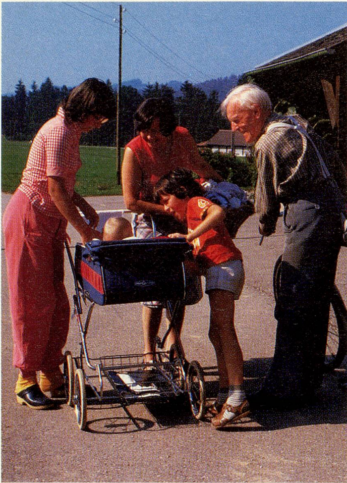
Für alle hat er ein freundliches Wort.