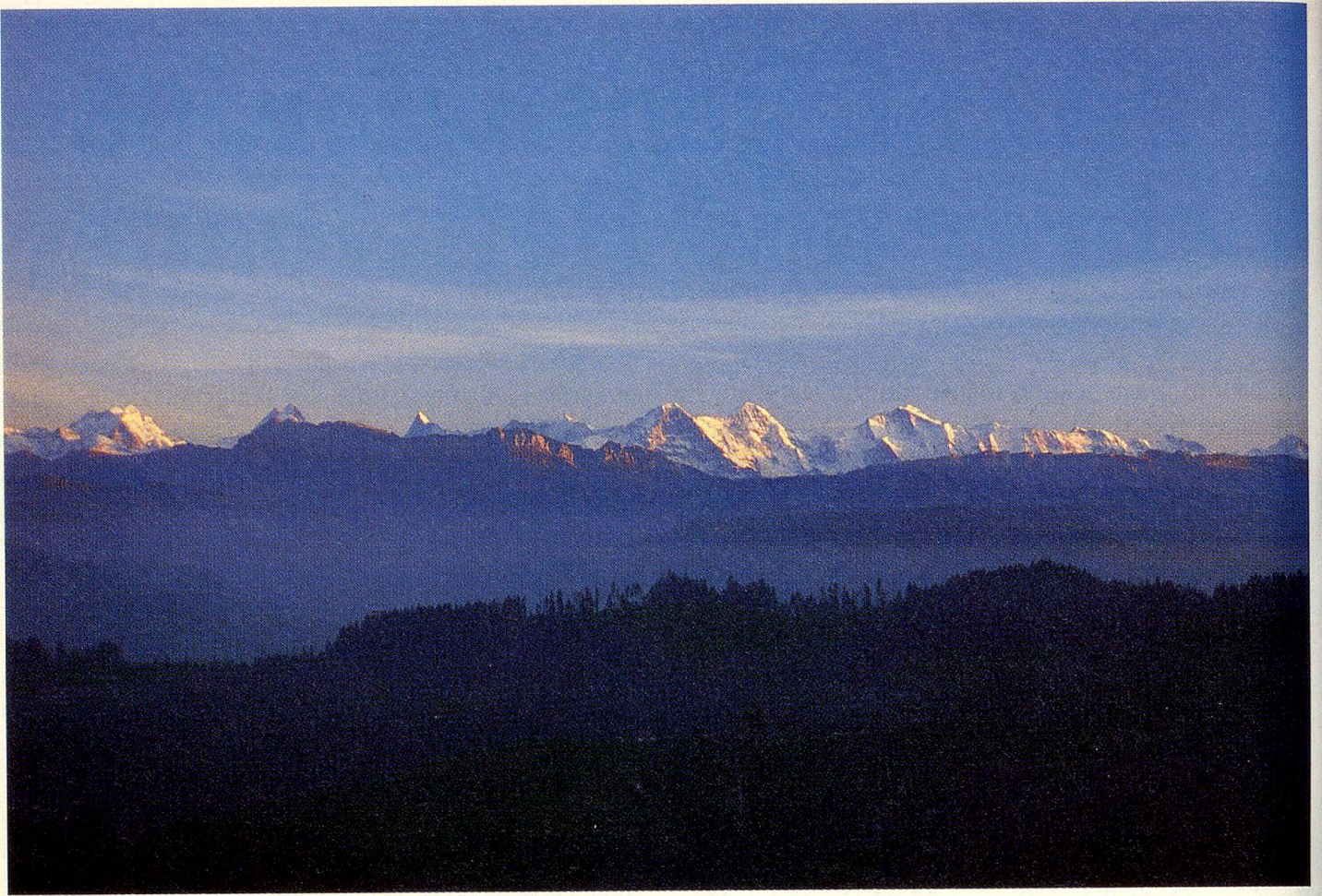
Alpenglühfen bei Sonnenuntergang, von der Moosegg aus gesehen. ▲