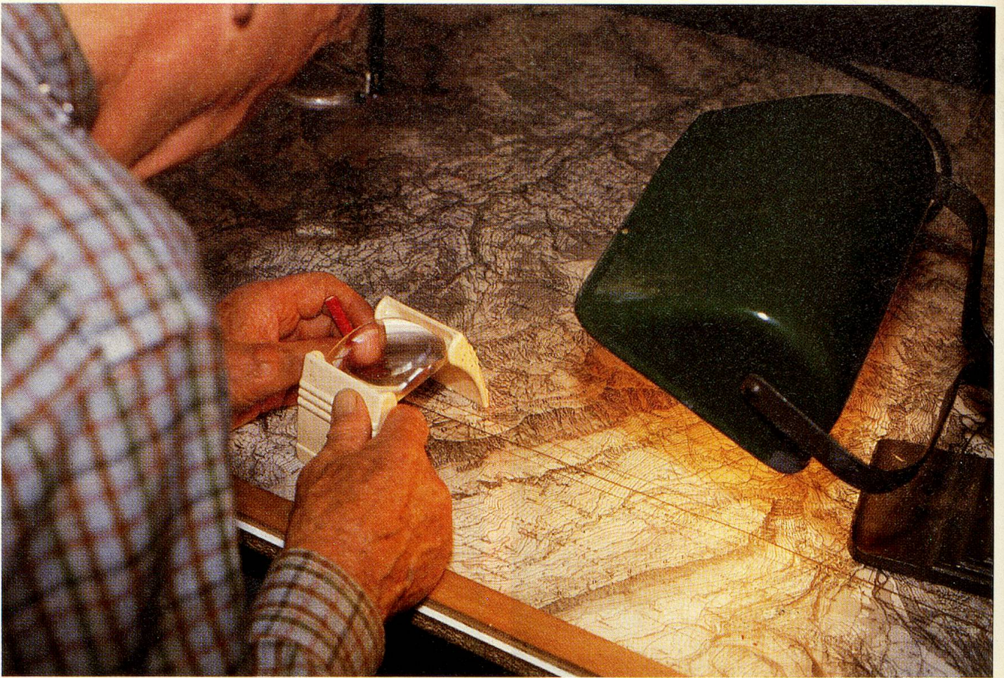
Sorgfältig zieht der ehemalige Lehrer mit dem Rotstift die Höhenkurven nach.