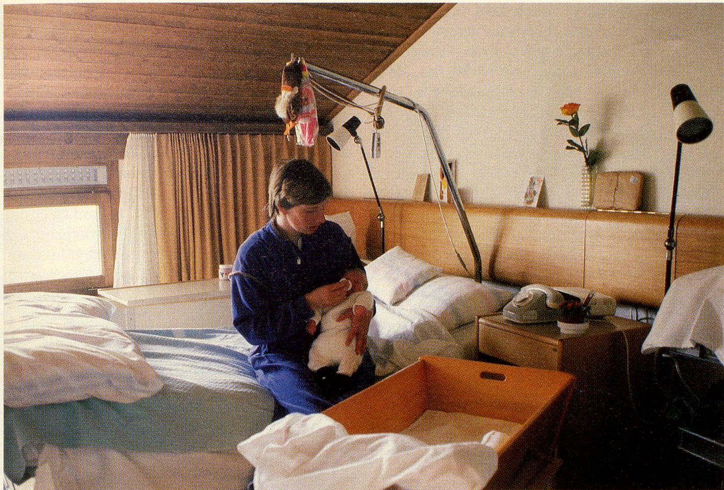
Eine Wöchnerin mit ihrem Kleinen im heimeligen Dachgeschoss der Geburtsabteilung.