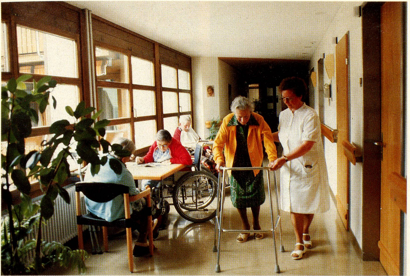
Auch die moderne Pflegestation wirkt sonnig und freundlich. Die Schwestern sind es auch.