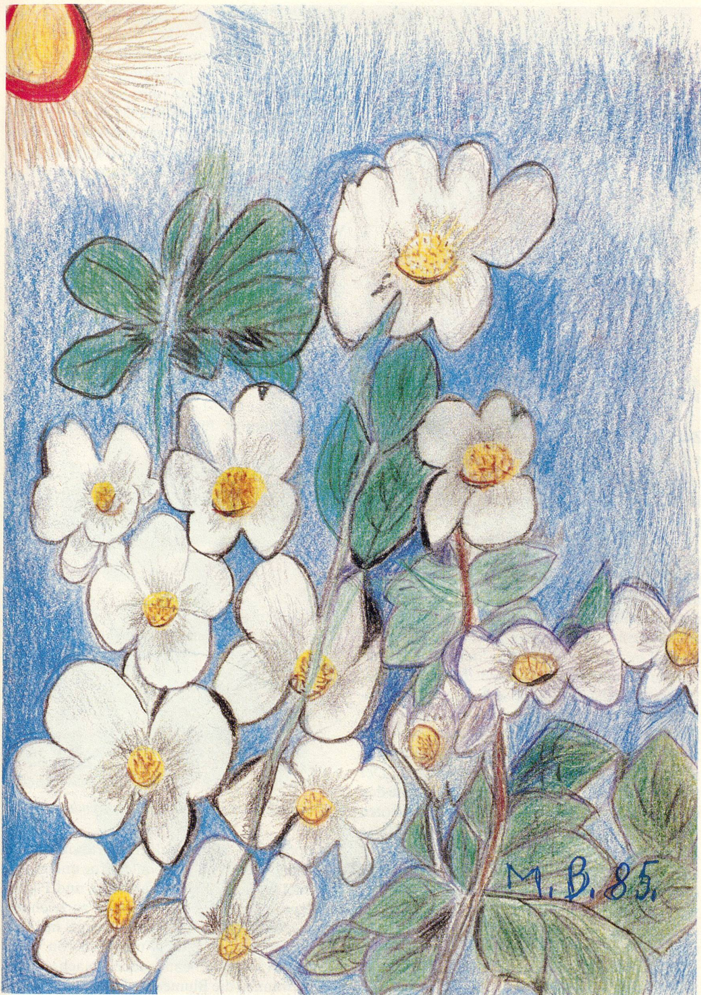
Diese Zeichnung wählte das Schweizerische Rote Kreuz für seine Glückwunschkarte.