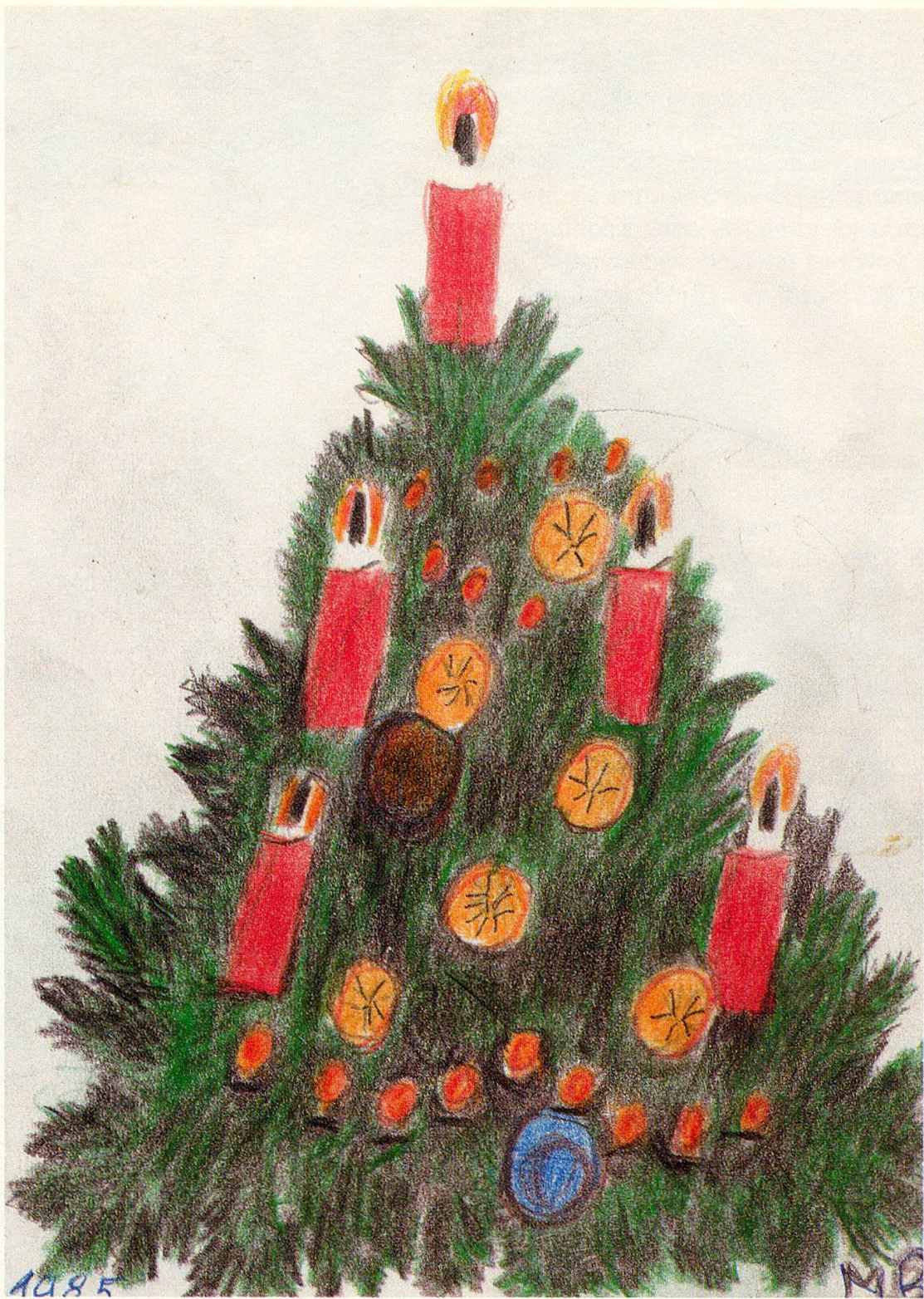
Hell leuchten die Kerzen am Christbaum, hell ist es auch im Herzen der betagten Frau geworden.