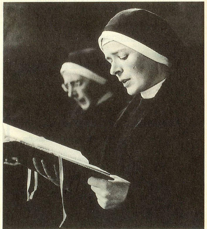
Klosterfrauen, ins Chorgebet vertieft.

man durchaus wörtlich nehmen. Die Schwestern singen – den Zuhörern verborgen – auf der Nonnenempore der Klosterkirche. Aus der Darstellung des Jüngsten Gerichts auf der Nordwand blicken die Engel hernieder auf die betenden Schwestern, die mit grosser Liebe den vom 2. Vatikanischen Konzil empfohlenen gregorianischen Choralgesang (in deutscher Sprache) pflegen. Dieser Gesang ist «monoton», das heisst, er wird auf einem Ton gesungen, schwillt etwas an und ab, erklingt etwas schneller, dann wieder langsamer. Die Beherrschung dieser Regeln ist gar nicht so einfach, wie man denkt, die Wirkung gerade in ihrer Einfachheit nachhaltig.