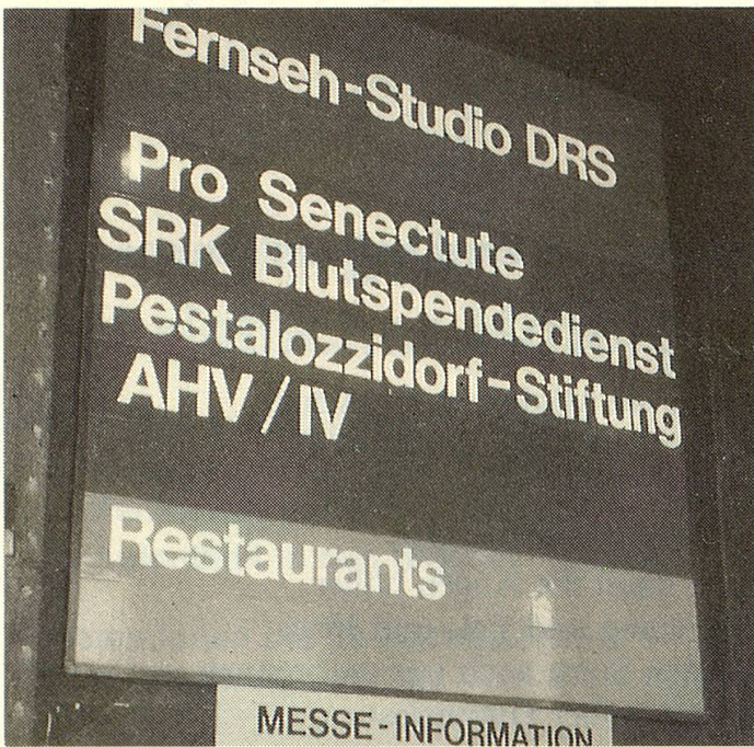
Der Pro Senectute-Stand am Eingang zur Halle D war nicht zu übersehen.