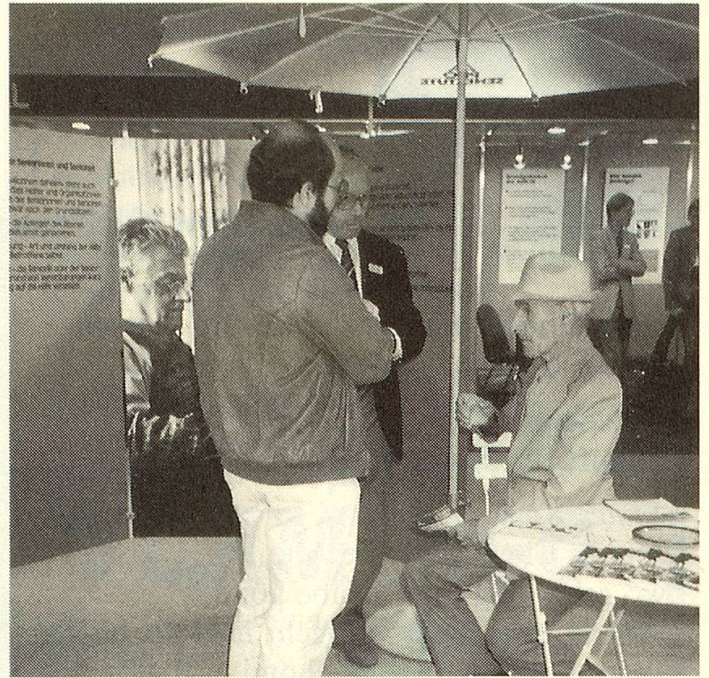
Die Sitzgelegenheiten waren höchst willkommen, es tat gut, die müden Füsse ausstrecken zu können. Foto es

Erstmals beteiligte sich Pro Senectute in diesem Jahr mit einem Informationsstand an der OLMA, der Schweizer Messe für Land- und Milchwirtschaft. Schrifttafeln, Bilder, Prospekte und eine Fernseh-Tonbildschau machten auf die mannigfachen Dienstleistungen unserer Stiftung aufmerksam, wobei aus naheliegenden Gründen das Angebot und die Möglichkeiten in der Stadt und im Kanton St. Gallen hervorgehoben wurden. Einen weiteren thematischen Schwerpunkt bildete das Wohnen daheim.