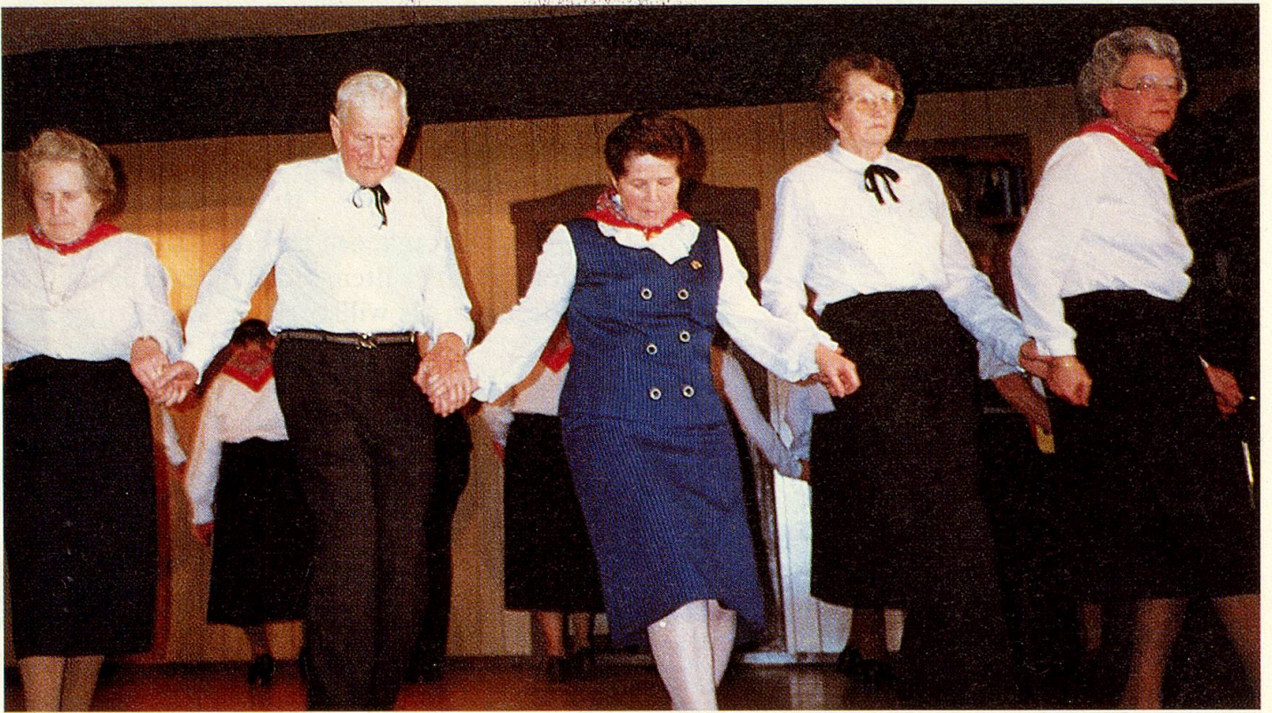
Die Volkstanzgruppe zeigt, was sie gelernt hat. Für den nächsten Kurs wird es in Obwalden noch mehr Anmeldungen geben!