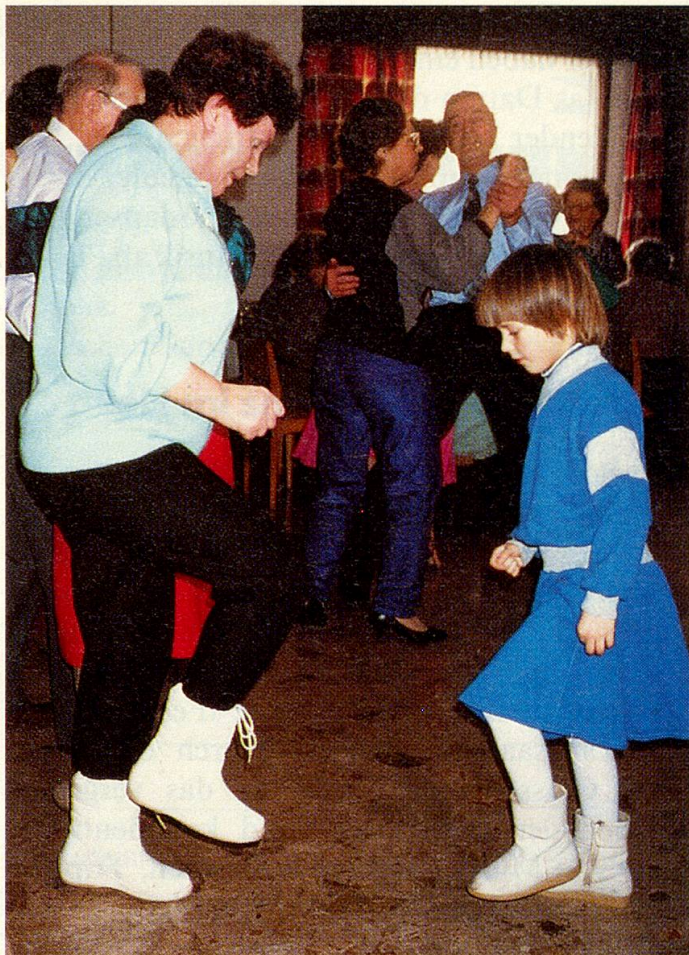
Einmal hin, einmal her, rundherum, das ist nicht schwer!