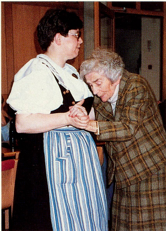
Ganz so schwungvoll wie einst im Kursaal von Lugano geht es nicht mehr, aber noch immer macht Tanzen Spass.

Einige Zuschauer haben «Sperrsitze» in der grossen Halle oder an einem Tisch der Cafeteria bezogen, die eine besonders gute «Fernsicht» auf den Tanzsaal versprechen. Durch den Filter einer Glasscheibe können sie das vergnügte Treiben genau verfolgen und kommentieren, ohne von Musik, Lachen, Schwatzen, Trippeln und Trappeln gestört zu werden.