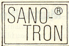
+ PATENT ANGEN.