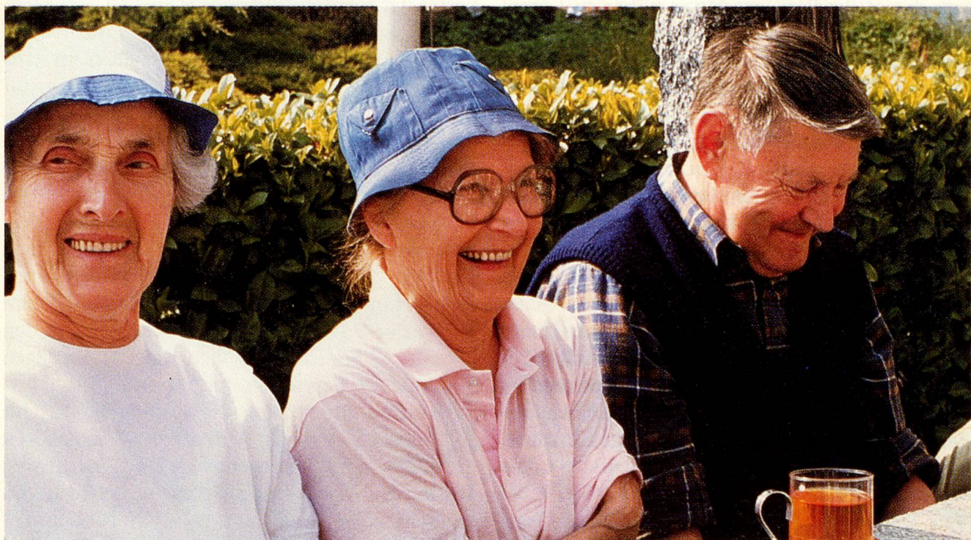
Die fröhlichen Gesichter beweisen es: alle unterhalten sich gut im Tessin.