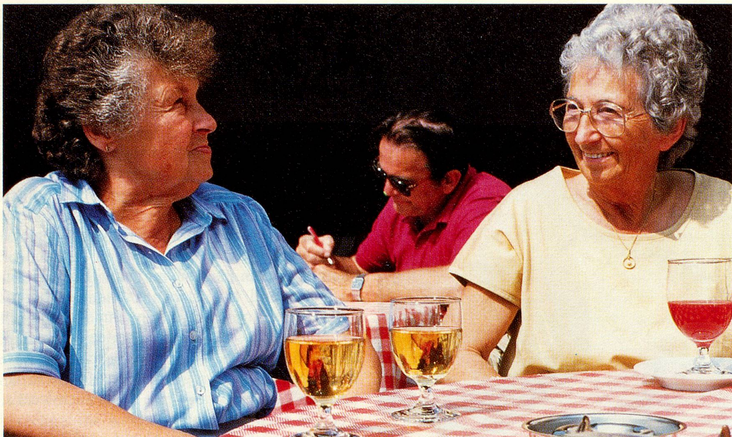
Am Nachmittag bleibt immer ein Stündchen Zeit für gemütliches Beisammensein.

Ähnliche Spannung liegt in der Luft vor dem traditionellen Lotto, bei dem es allerhand kleine Preise zu gewinnen gibt.