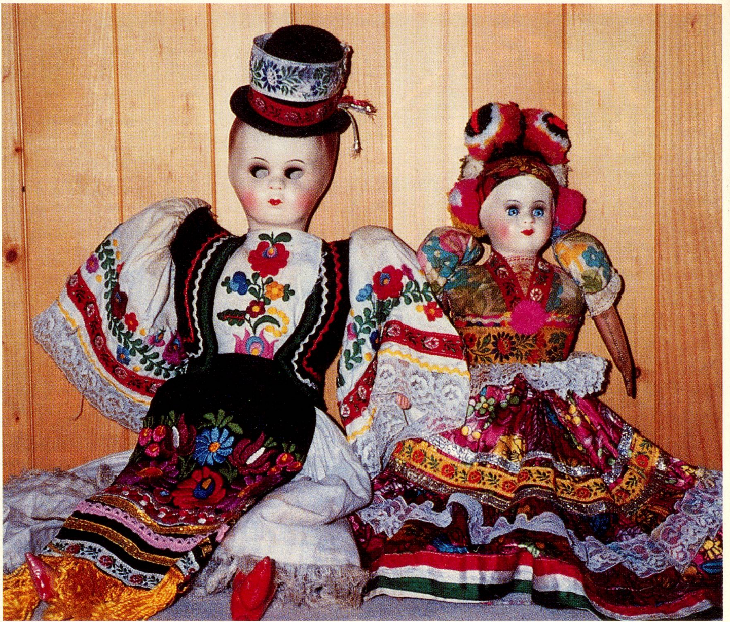
Russische Flüchtlinge fabrizierten einst die schönen Kosakenpuppen, die bei Einheimischen und Touristen reissend Absatz fanden.