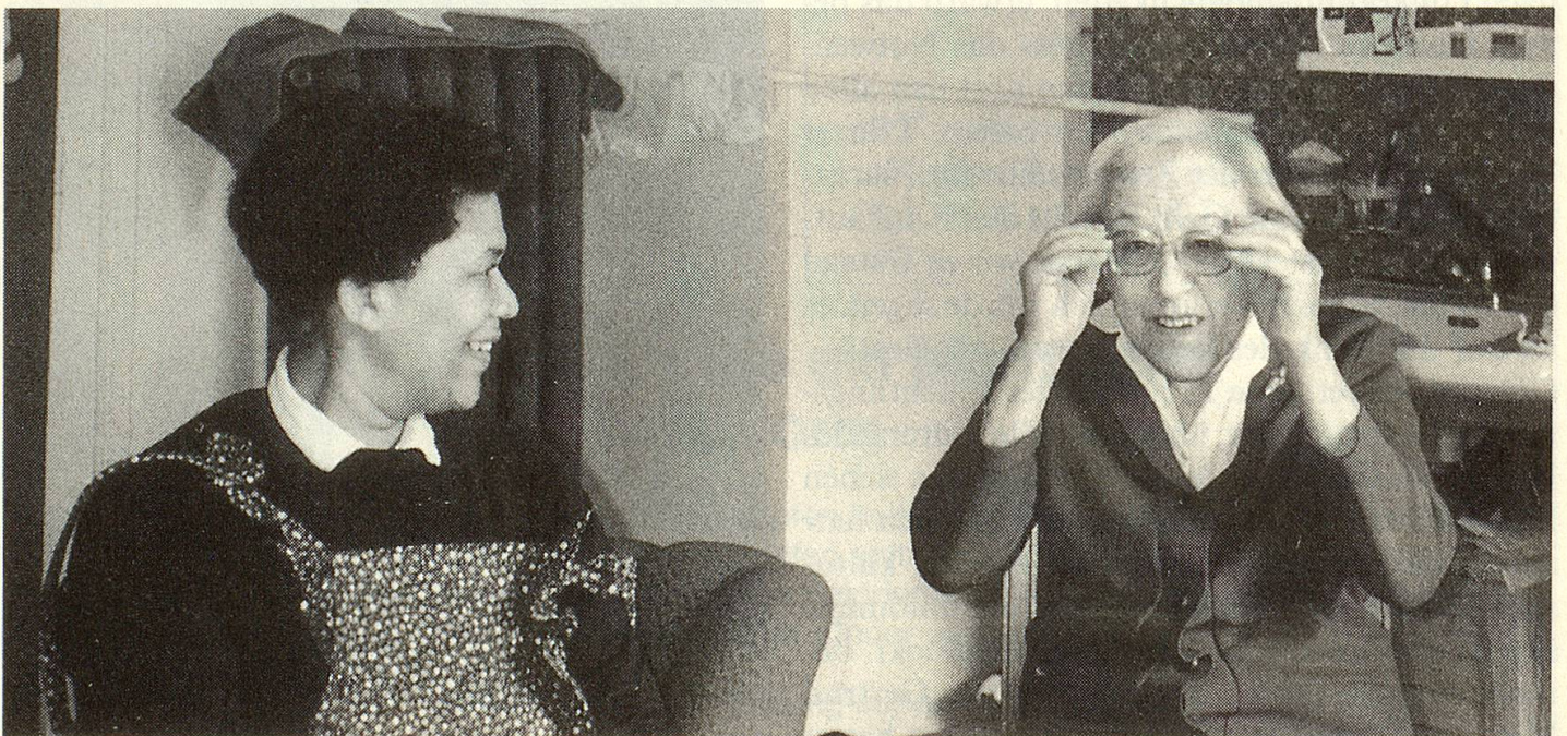
Die Schweizerin und die Pensionärin aus dem schwarzen Erdteil verstehen sich gut. Konversationsprache ist englisch.

Die Pensionäre sind jünger geworden. Bei den Vietnamesen handelt es sich zumeist um psychisch geschädigte Menschen, die kaum in einer Gemeinschaft eingegliedert werden können. Fast alle Vietnamesen haben Angehörige, zu denen sie auch auf Besuch gehen, die sich aber nicht auf die Dauer um sie kümmern können. In der «Alpenruhe» helfen sie nach Möglichkeit mit in Haushalt und Küche. Eine Putzfrau kommt aus Portugal, ein Angestellter ist Tamile. Die wenigen Schweizer, die jetzt im Flüchtlingsheim wohnen, wären in einem Alters- oder Pflegeheim unglücklich, in einer psychiatrischen Klinik fehlplaziert, in einer eigenen Wohnung überfordert. In ihrem Zimmer in der «Alpenruhe» leben sie ihr eigenes Leben, bauen sie sich ihre eigene Welt.