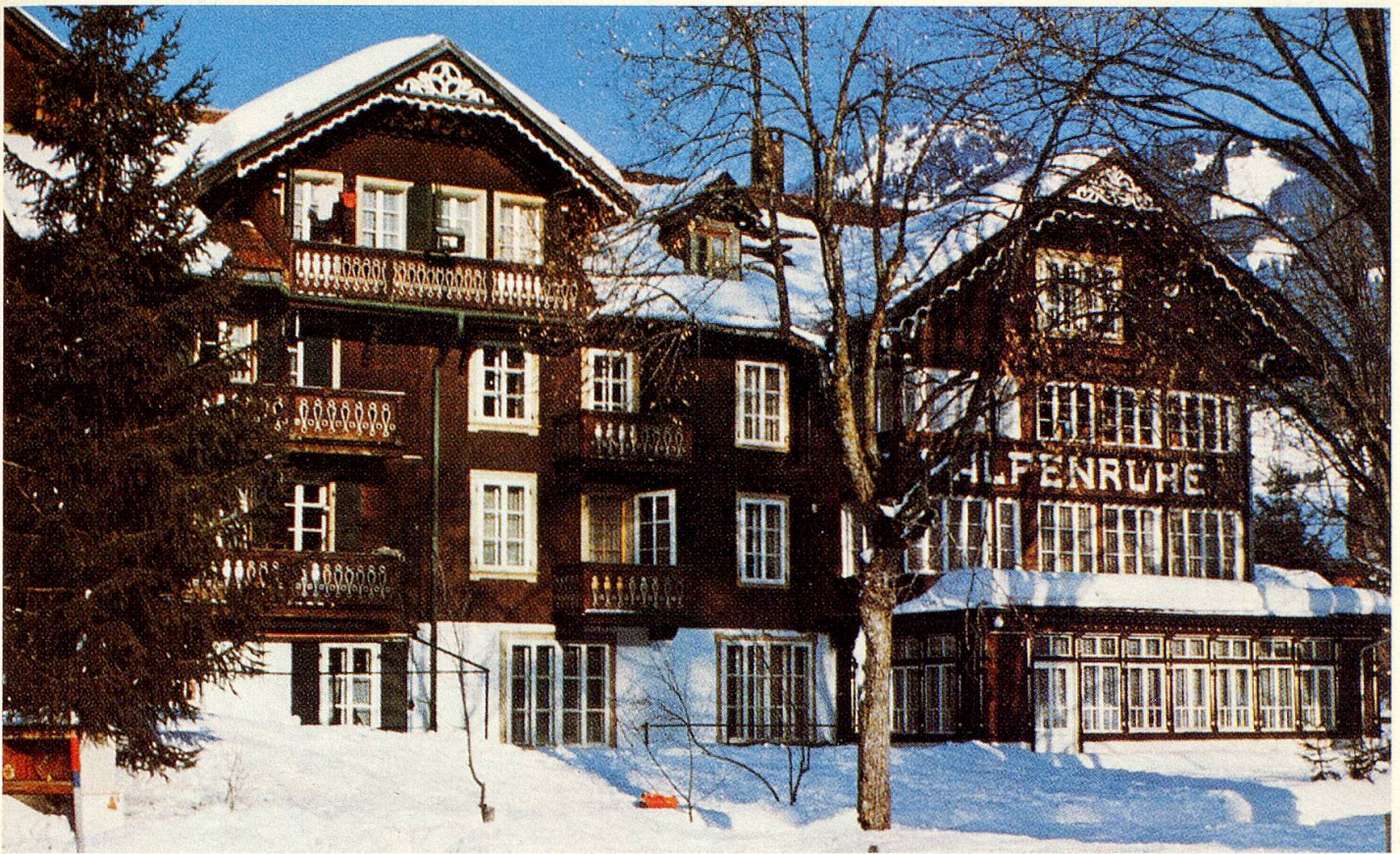
Die «Alpenruhe» im Schnee hat für Gäste, die aus fernen Ländern kommen, einen besonderen Reiz.