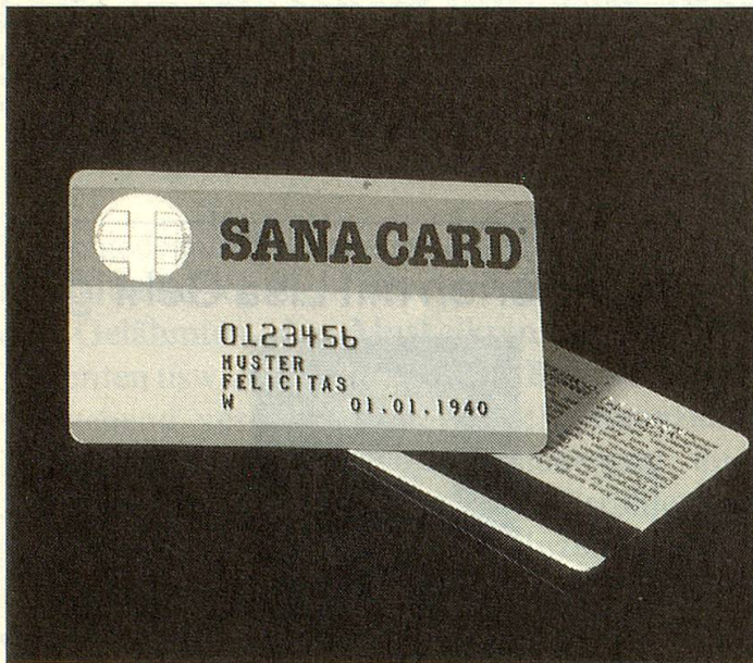
Die «Sanacard», die Notfall- und Patientenkarte mit dem Microcomputer (oben links auf der Karte sichtbar).

Die «Sanacard», die neue Notfall- und Patientenkarte in Kreditkartenformat, soll die Hilfe für Patienten im Notfall verbessern und beschleunigen, Verwaltungsarbeiten in den Spitälern vereinfachen und dem Arzt helfen, schneller an nötige Informationen zu kommen.