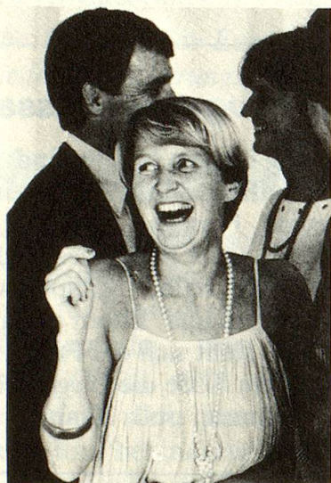
Über 200 000 Frauen und Männer in der Schweiz leiden an Unstimmigkeiten der Blasenkontrolle.

Viele Leute leiden unter dem kleinen Malheur, die Blasenentleerung nicht unter Kontrolle zu haben. Sie leben mit der Angst, nicht rechtzeitig auf die Toilette zu kommen, und ziehen sich aus dem aktiven Leben zurück und vereinsamen.