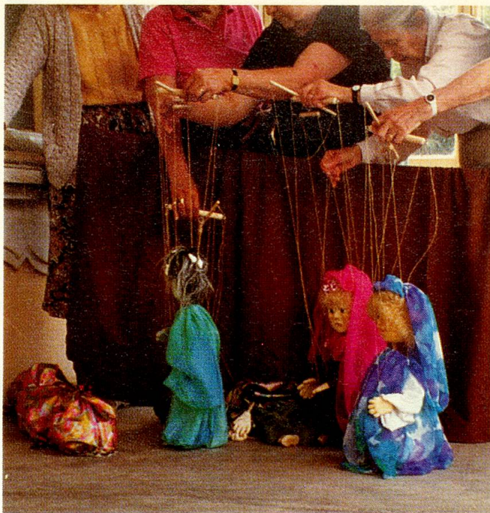
Damen drängen sich vor und hinter der Spiel- leiste, die später abgebaut wurde.

Mit einer vielgelobten Vorstellung fanden die Aktivferien von Tesserete wie vorgesehen und zur vollen Zufriedenheit aller Beteiligten ihren Abschluss. Der Verzicht auf die bloss störende