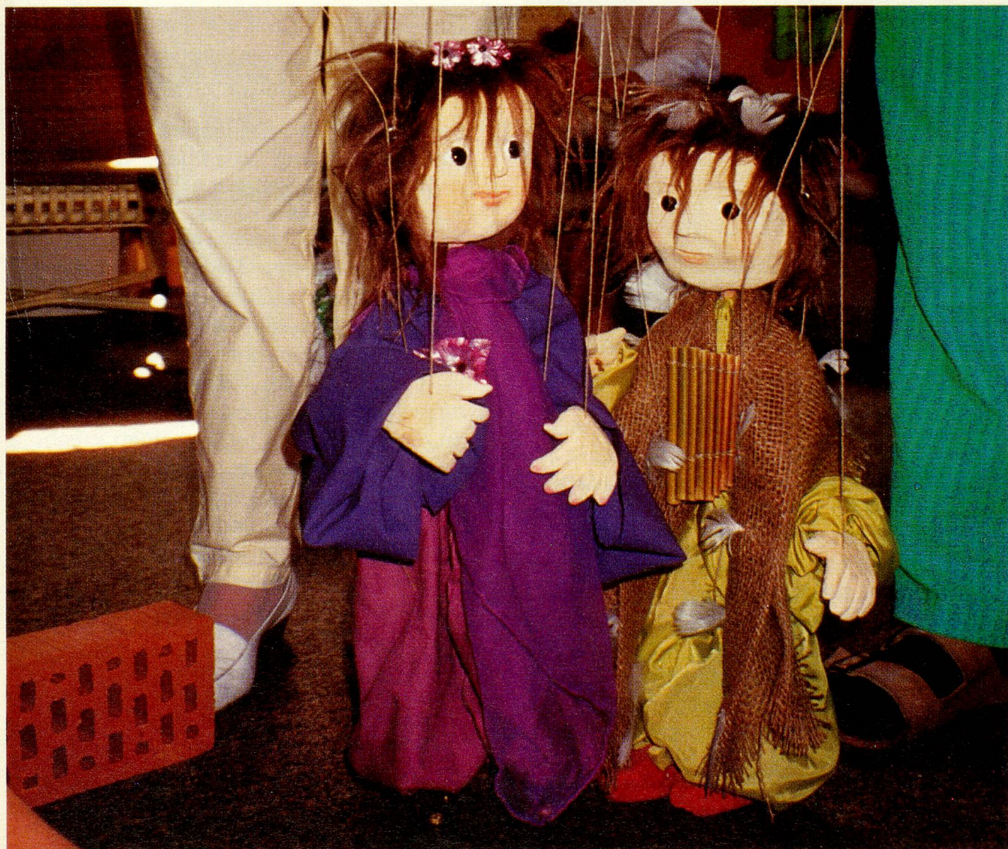
Pamina und Papageno versuchen, das Wesen der Liebe zu ergründen.