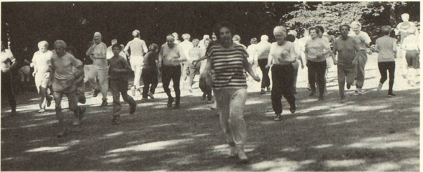
Je nach Witterung kommen auf den wöchentlichen Lauftreffs über 100 rüstige Seniorinnen und Senioren zusammen.

Schliesslich hat eine frischpensionierte 65jährige Frau andere Sportbedürfnisse als ein 85jähriger Mann, der in einem Heim lebt. Einer, der zeitlebens sportlich aktiv war, will ein anderes Programm als jemand, der erst nach der Pensionierung anfängt, regelmässig Sport zu treiben. Für alle kann aber angemessene Bewegung die Lebensqualität und das Wohlbefinden steigern. Wichtig sind das Mitmachen und das Bewusstsein, dass es nie zu