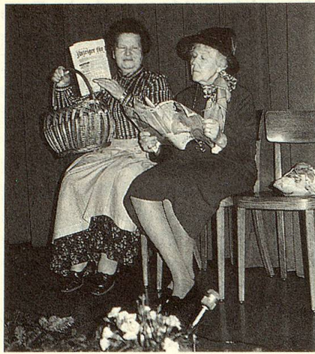
Die Senioren-Bühne der Johanneskirche Bern feiert ihr 10jähriges Bestehen.