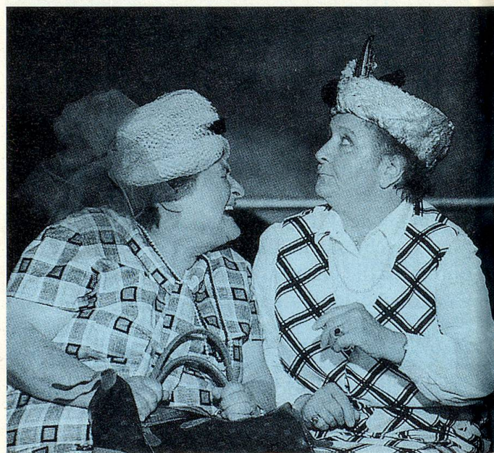
Auch das Senioren-Theater gehört zu den Aufgaben des Seniorenrates.