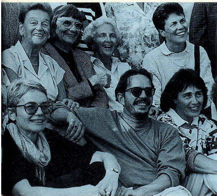
Die «Zusammenarbeit» des Seniorenrates mit der jüngeren Generation klappt auch auf anderen Gebieten.