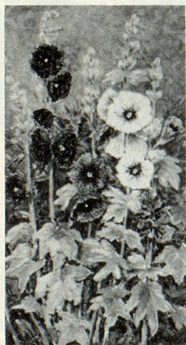
Malven, nach der Natur gemalt.