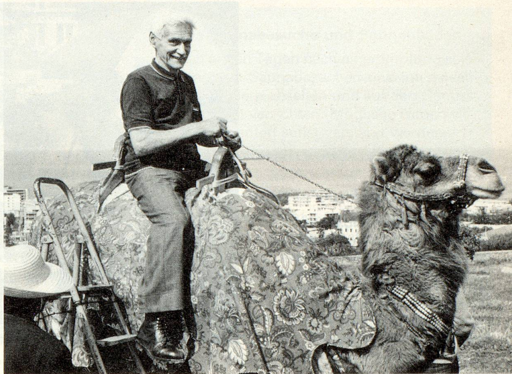
Bei Ferienreisen oder längeren Aufenthalten in tropischen oder subtropischen Ländern ist ein umfassender Impfschutz nötig.