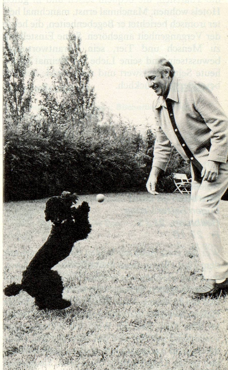
Der Spieltrieb bleibt dem Hund – wie auch dem Menschen – das ganze Leben lang erhalten.