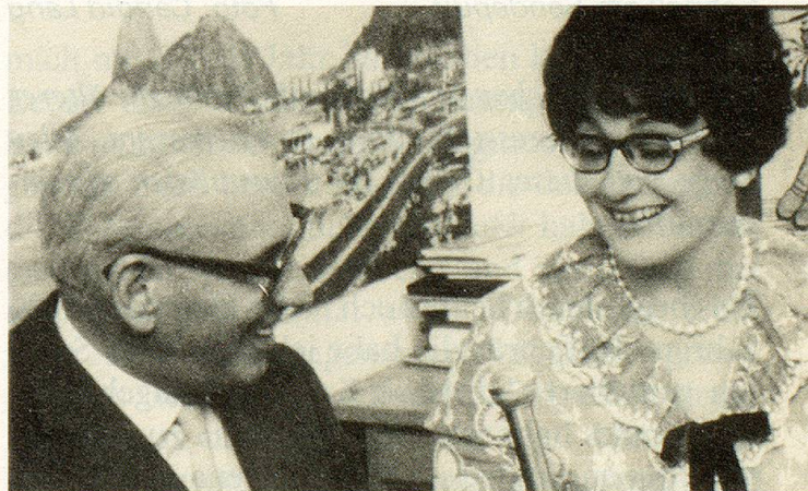
Die erste Radio-Reporterin im Interview mit Robert Lembke.