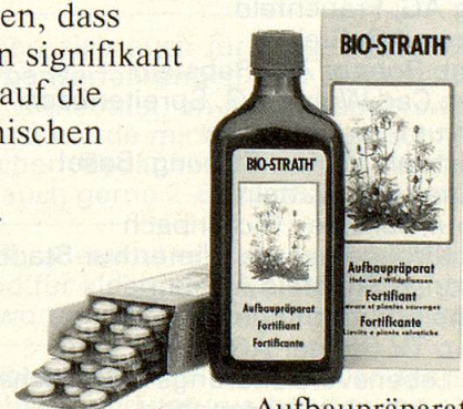
Aufbaupräparat Hefe und Wildpflanzen

BIO-STRATH hilft bei Müdigkeit, stärkt die Widerstandskraft und erhöht die Vitalität. In einem kontrollierten wissenschaftlichen Versuch ist kürzlich festgestellt worden, dass BIO-STRATH einen signifikant positiven Einfluss auf die physischen, psychischen und mentalen Leistungen hat.