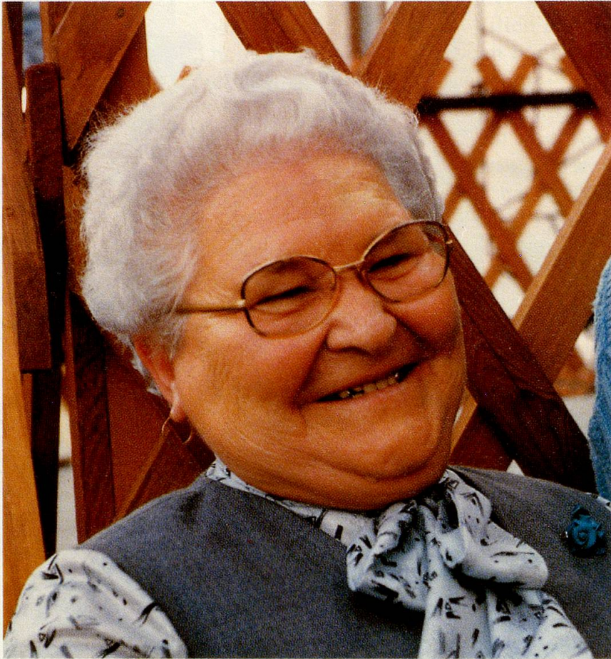
Diese ungarische Rentnerin erhält etwa 6000 Forint (ca. 130 Franken) im Monat. Sie ist gezwungen, dazu zu verdienen.

passung greifbar zu werden: Junge Menschen im Alter von 25 bis 35 Jahren, die sich durch stetige Diskussionen mit den Entwicklungen auseinandersetzen, verstehen jüngere nicht