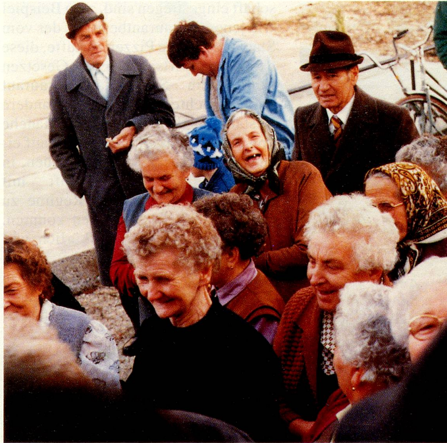
Senioren erwarten die ausländischen Gäste.

Kinder zählen unter solchen Umständen zum Luxus. So gewähren gewisse Wohnbaugenossenschaften Familien beim Kauf einer Wohnung hohe Rabatte, wenn sich diese verpflichten, innerhalb von fünf Jahren zwei Kinder auf die Welt zu stellen ... Doch aus finanziellen Gründen ist es den Müttern gleichwohl nicht möglich, bei ihren Kindern zu bleiben, sie sind gezwungen zu arbeiten. Kinder werden während der Woche meistens in Tagesheimen untergebracht, schon vom ersten Lebensjahr an. Nur selten können Grosseltern die Erziehungsaufgaben übernehmen, da auch diese neben ihrer Rente auf ein Zusatzeinkommen angewiesen sind. Dies mag in den Dörfern anders sein, spielt doch hier noch die Nachbarschaftshilfe. Die Grosseltern sind eher zu Hause, besorgen ein kleines Feld und halten Tiere für die Selbstversorgung. Doch auch