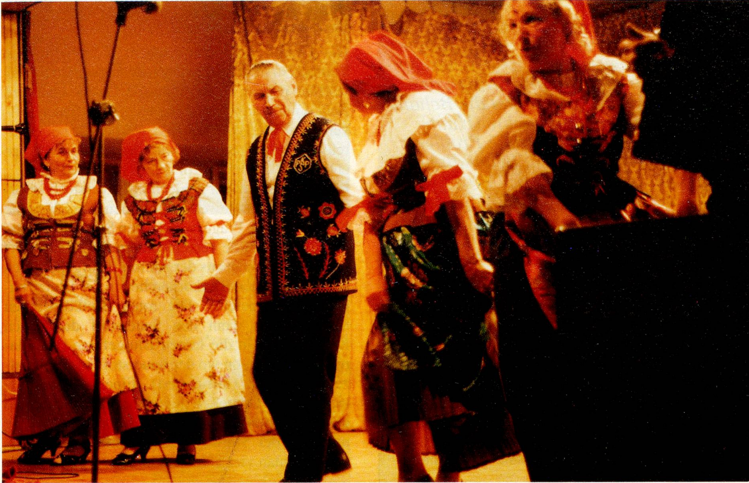
Im ländlichen Kulturhaus: Polnische Gruppe.

darstellte. Er zeigte diesen Menschen, dass Menschen aus dem Ausland es für wichtig erachteten, zu ihnen zu kommen, sie ernst zu nehmen.