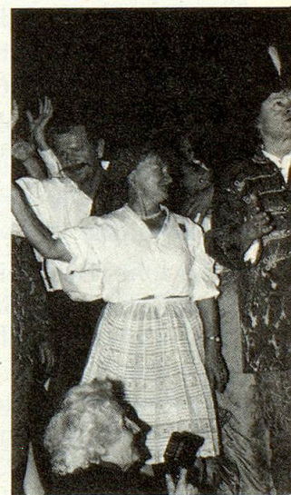
Gala-Vorstellung in Budapest: Auf Wiedersehen im nächsten Jahr.

stellung aller Gruppen im Theater von Budapest. In bunter Folge wechselten die ausländischen mit den eigenen Darbietungen: Gebannt lauschten die zahlreichen Zuschauer vor allem den Produktionen aus Ungarn und den ehemals ungarischen Gebieten. Es schien, dass manches noch bekannt war, dass viele sich noch an die Zeit um 1920 erinnern konnten. (Im Vertrag von Trianon wurde festgelegt, dass Ungarn zwei Drittel seines Gebietes in die umliegenden Staaten abtreten musste.) Die Zuschauer vereinten sich in alten Gesängen, wiegten sich in Jugenderinnerungen und träumten ihren Traum von vergangener Größe.