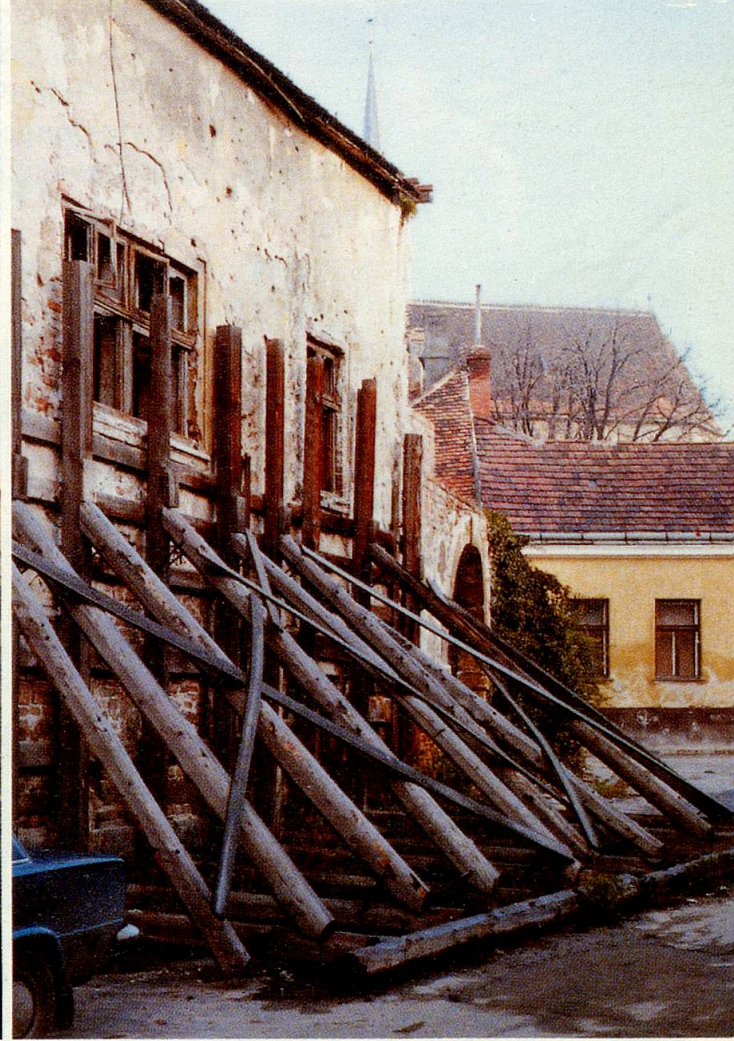
Budapest: Einzelne renovierte Gebäude lassen die andern Häuser noch älter aussehen. – In Sopron: Noch steht die Fassade ...

der Produktion auch die Umwelt ihre Forderungen stellt. Und wenn man fragt, wie lange gibt es etwas schon, so antworten die Ungarn nicht wie wir in Jahrzehnten oder Jahrhunderten. Sie können auf den Tag genau sagen, seit wann es die Neureichen gibt, seit wann es das mit amerikanischen Motiven verzierte und schnelles Geld versprechende Rubbelspiel gibt (bei meinem Besuch waren es 2 Wochen), seit wann die Bürgermeister im Amt stehen. (Die demokratisch gewählten Bürgermeister waren zur Zeit des Senioren-Festivals seit etwa einem Monat im Amt.)