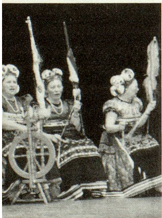
Tradition und Volksgut wird sorgfältig bewahrt.