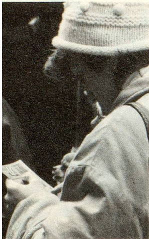
Der Traum vom schnellen Geld: Amerikanisch herausgeputzte Rubbelkarten locken mit hohen Gewinnen.