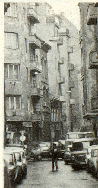
Das Auto besitzt absoluten Vortritt – selbst auf dem Trottoir.

sen Läden oder Geschäftshäuser nach westlichem Muster aus dem Boden. Manchmal sind diese nur hinter glänzenden, in buntem Neonlicht gleissenden Fassaden versteckt, während die darüberliegenden Stockwerke noch schneller zu verfallen scheinen. Manchmal stehen sie monumental inmitten von noch nicht ausgewechselten zerfallenden Gebäuden aus der österreichisch-ungarischen Hochzeit der Jahrhundertwende. Sie wirken als Symbol für die Öffnung, für die Hinwendung zum Westen. Sie stehen aber auch für den abrupten Wechsel eines Gesellschaftssystems, das in rasender Schnelle und unbesehen alles, was im Westen gilt, zu den eigenen Zielen erklären will. Bereits scheinen die Auswirkungen dieser schnellen An-