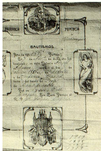
Dieses Taufzertifikat aus dem Jahre 1895 «überlebte» die Widrigkeiten der tropischen Umwelt in einer Bambusröhre.