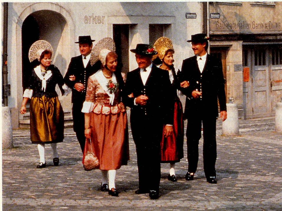
Eine Gruppe Trachten aus dem Kanton St. Gallen