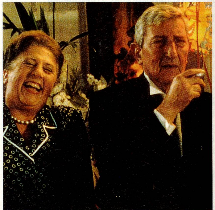
Die Grosseltern: Seele des Hauses.