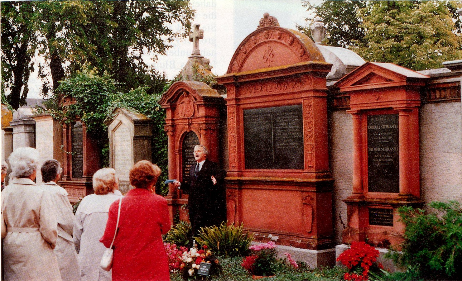
Viele an Gottesacker-Kultur interessierte Menschen schlossen sich letztes Jahr den pietätvollen «Friedhofs-Promenaden» an.

derzusetzen, denn «Tote können geistig noch sehr gegenwärtig sein!»