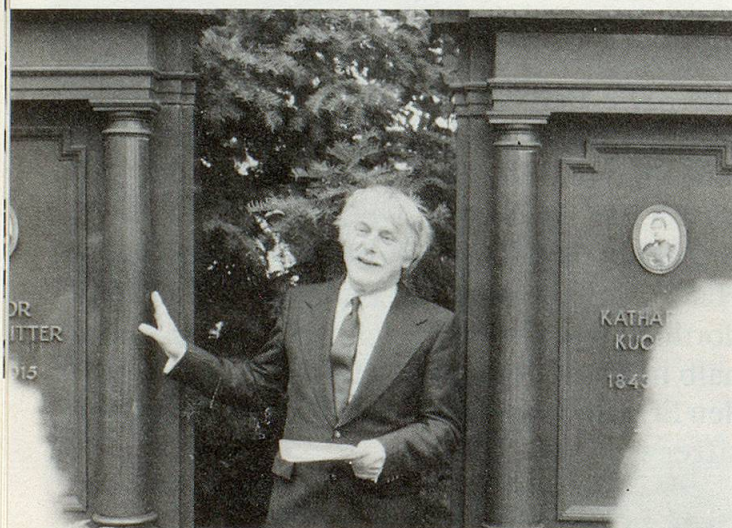
«Zwei sich Liebende konnten im Leben nicht zueinander kommen. Sie liessen sich dafür nebeneinander begraben und dokumentierten ihre Verbundenheit mit den gleichen Grabsteinen.»

dabei ist, dass er in der Zeit zu Hause ist, wo die von ihm beschriebenen Menschen lebten. Sie sind ihm wertvoll, er behandelt sie mit grosser Pietät, stellt auf den Führungen – bei nahe unbemerkt – bei diesem Grab ein umgefallenes Blumenstößchen wieder auf, wischt bei jenem einen Grabstein sauber.