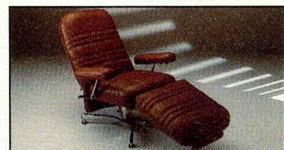
Everstyl „Trocadero“, zeitlos modern