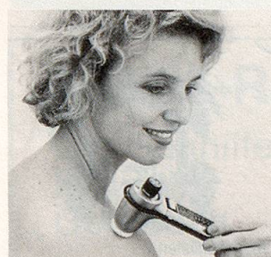
Modell SK2 (100-8000 Schwingungen/Sek.)

Unzählige Menschen jeden Alters in über 15 Ländern greifen in solchen Momenten ganz einfach nach dem NOVAFON-Schallwellengerät. Es bringt ihnen Entspannung, Linderung und Wohlbefinden.