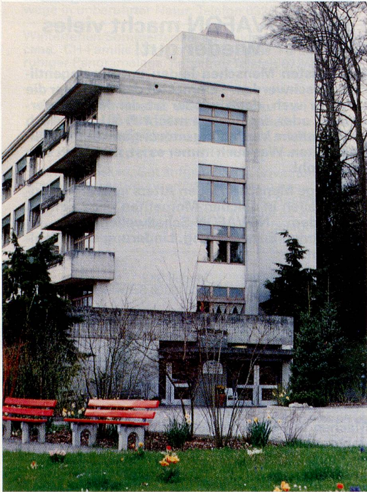
Der «Hirschpark» – trotz des Spitalgebäudes ein wohnliches Heim.

U m dem Mangel an Pflegebetten möglichst rasch abzuhelpfen, baute die Bürgergemeinde Luzern ein Haus des Kantonsspitals zum Pflegeheim «Hirschpark» um. Ein Viertel der 60 Betten wird für Kurzzeit-Aufenthalte benutzt. Im «Hirschpark» gilt die Devise: Menschen nicht einfach pflegen, bis sie resignieren und vor sich hindämmern, sondern ihnen helfen, möglichst unabhängig zu sein.