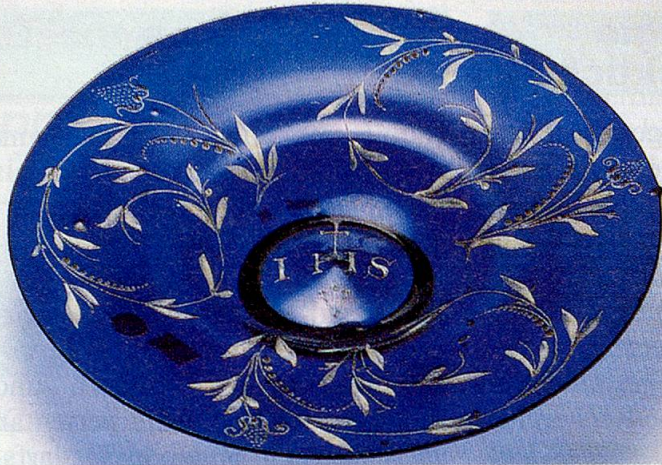
Teller aus Kobaltglas mit weisser Emailmalerei, vermutlich Böhmen, 1. Hälfte des 16. Jahrhunderts.