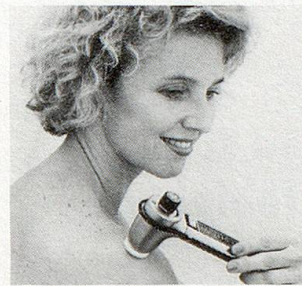
Modell SK2 (100–8000 Schwingungen/Sek.)

Unzählige Menschen jeden Alters in über 15 Ländern greifen in solchen Momenten ganz einfach nach dem NOVAFON-Schallwellengerät. Es bringt ihnen Entspannung, Linderung und Wohlbefinden.