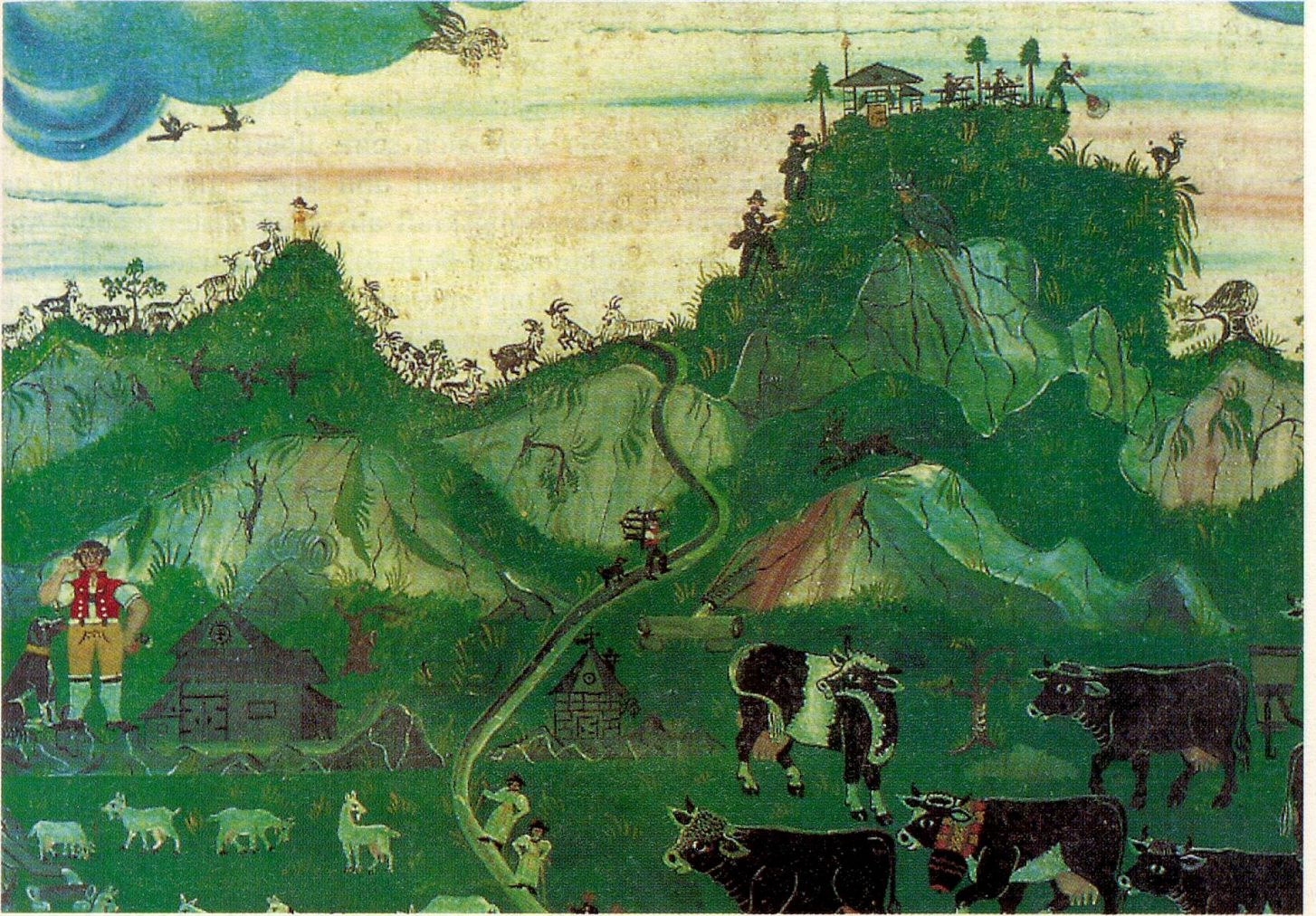
Bartholomäus Lämmli, «Die Ansicht der Kammohr, der Hohe Kasten und Staubern», 1854 (Originaltitel des Malers). Lämmli darf ohne Übertreibung bis heute als genialster unter den Bauernmalern bezeichnet werden.