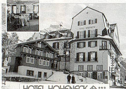
HOTEL HOHENECK ◆◆◆

Ihr Ferienhotel im Winterparadies Engelberg OW, 6390