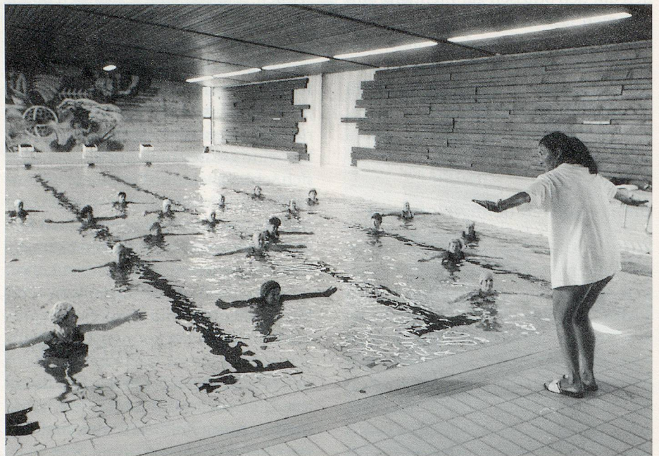
Wassergymnastik kann jedermann betreiben – es trainiert den ganzen Körper und ist erst noch wohltuend.

W assergymnastik – auch Aqua-Fit oder Aqua-Gym genannt – nutzt die Wirkungen des Wassers auf den menschlichen Körper geradezu ideal aus. Einerseits fördert die «Arbeit» im Wasser