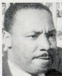
Zum «Erinnern Sie sich noch?» aus Heft 6/95

Aus den richtigen Antworten ziehen wir funf Gewinner, unter welchen wir einen Blumenstrauss (gestiftet von Winterthur Leben) und vier Abonnemente der Zeitlupe zum Weiterverschenken verlosen.