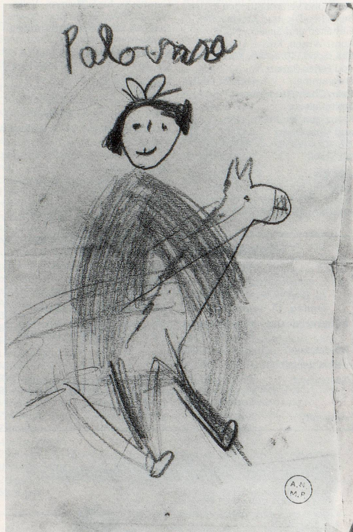
Kinderzeichnung von Paloma Picasso: Reitendes Mädchen, 1956.

Vom 7. September bis zum 26. November 1995 zeigt das Kunstmuseum Bern eine äusserst interessante Ausstellung unter dem Titel «Mit dem Auge des Kindes. Kinderzeichnung und Moderne Kunst», die im Sommer bereits in München in der Städtischen Galerie im Lenbachhaus zu sehen war. Die Ausstellung konfrontiert die Betrachtenden mit einem der beliebtesten Klischees im Umgang mit moderner Kunst, dem Vorwurf nämlich, dass die Zeichnungen von Kindern den Werken avantgardistischer Künstler ebenbürtig seien. Diesen Vorwurf haben viele bedeutende Künstler unseres Jahrhunderts in sein Gegenteil verkehrt, indem sie ausdrücklich auf die geistige Verwand-