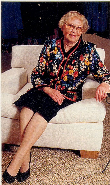
Ein Deux-pièces , hervorragend geeignet für Besuche und Theater

Brauchen wir Alten – ich bin Mitte der Siebziger – uns nicht mehr darum zu kümmern, was sich heutzutage für elegante Zeitgenossen ziemt? Sind wir nur noch genötigt, unseren physischen Faltenwurf mit Textilien von gestern zu verhüllen? Wäre dies so, hätten die führenden Kleidergeschäfte wahrhaftig keinen Grund mehr, uns Senioren überhaupt zur Kenntnis zu nehmen. Wir gehören für sie ja in unserer grossen Mehrheit auch nicht zur potenten Kaufkraftklasse.