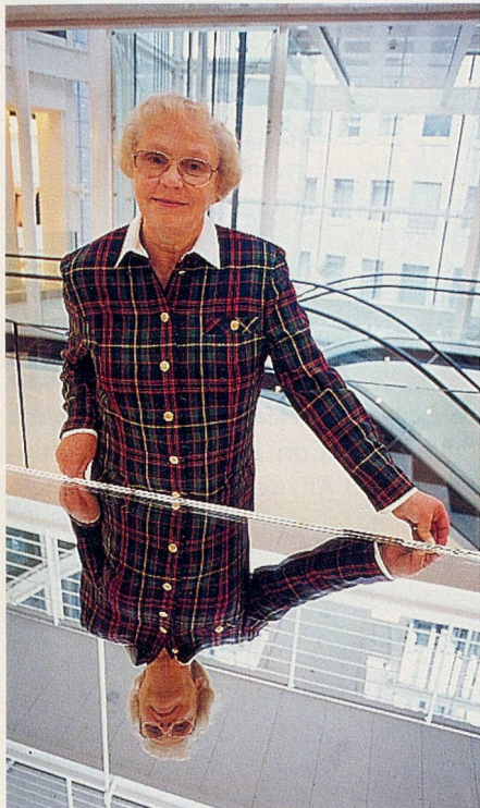
In der Ambiance des Modehauses mit seiner modernen Architektur kommt das gepflegte Kleid besonders gut zur Geltung.