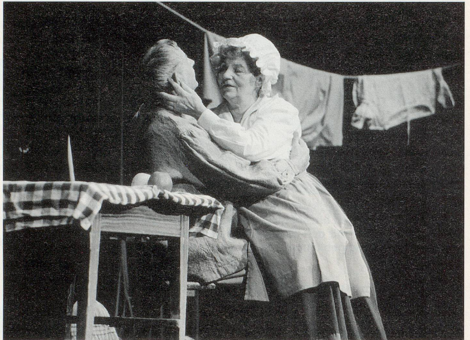
Seniorentheater «Zeitlos» aus Rathenow/Deutschland mit dem Hans-Sachs-Stück «Der tote Mann».