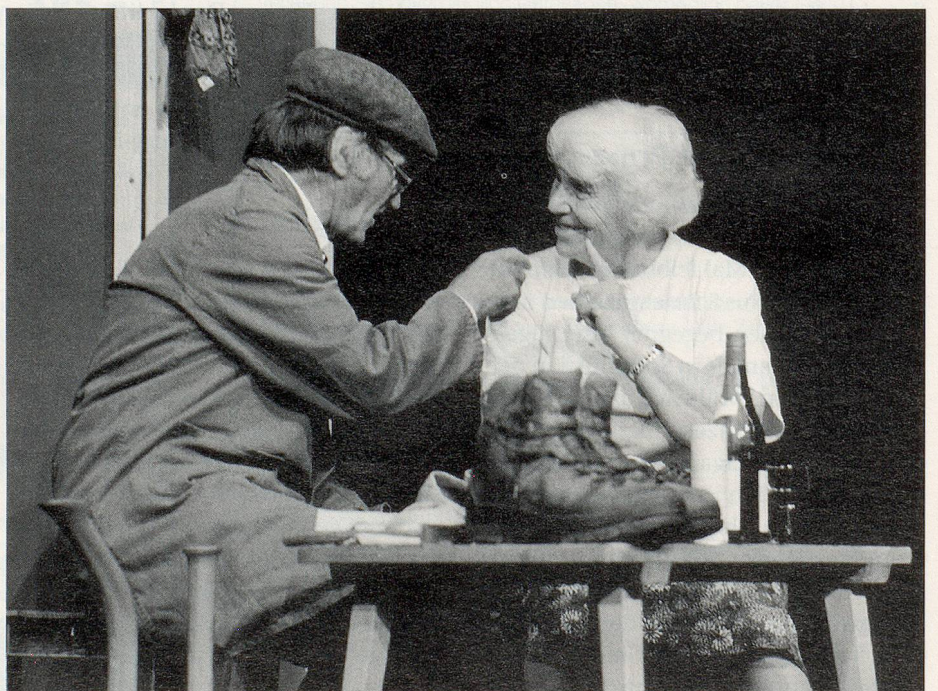
Seniorentheater Uttigen. «Mueters nöi Läbesphilosophie» nach der Erzählung von Bertold Brecht «die unwürdige Greisin».