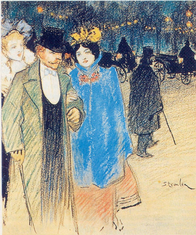
Nach dem Theater um 1900, Pastell und Tuschfeder von Théophile-A. Steinlen

Die Herbst-Ausstellung im Seedamm-Kulturzentrum Pfäffikon ist einem bedeutenden, hierzulande jedoch wenig bekannten Westschweizer Künstler gewidmet. Théophile-A. Steinlen wurde 1859 in Lausanne geboren, übersiedelte 1879 nach Mülhausen und 1881 nach Paris. Inmitten einer turbulenten Epoche errang er in seiner Wahlheimat Paris hohes Ansehen als Maler, Zeichner, Illustrator und Plakatgestalter. Nicht die Schönheit der Stadt und ihrer Denkmäler, sondern das Alltagsleben, die Sorgen und Nöte, aber auch die Freu-