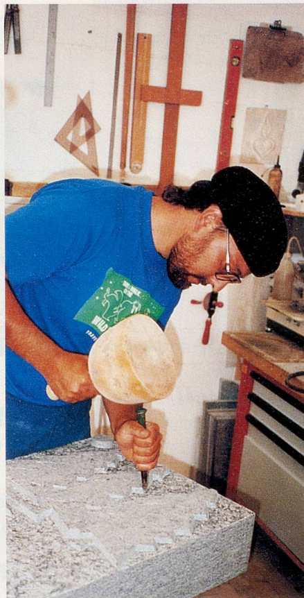
Grabmalkultur ist seit Urzeiten auch Menschheitskultur.

«Wir versuchen, den Hinterbliebenen eine gewisse Trauerarbeit abzunehmen, sie zu trösten. Verliert man einen geliebten Menschen, so vermisst man ihn. Ein Grabmal ist eben nicht nur eine Platte mit einem Namen darauf, sondern es greift in symbolischer Art etwas aus dem Leben des Verstorbenen heraus und macht damit den Friedhof