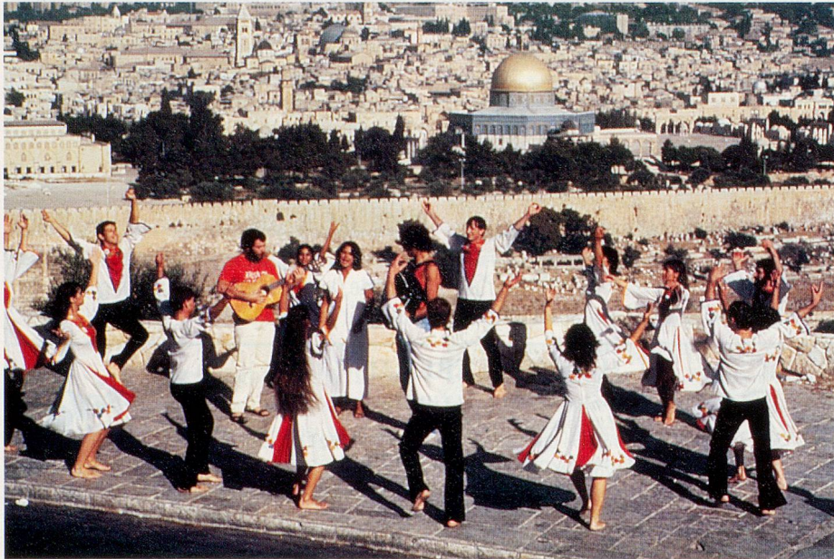
Jerusalem 3000: Israelische Volkstänze in der Stadt König Davids.