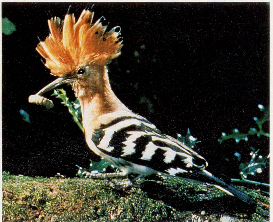
Ein Wiedehopf im Parc National des Cévennes

In Berlin haben sich ältere Frauen und Männer aus allen Stadtteilen zusammengefunden, um auswärtigen Besuchern ihre Stadt zu zeigen. Im Prospekt der Gruppe heisst es: «Überraschungsrouten sind unsere Spezialität. Jede(r) von uns möchte Ihnen (s)ein Stück Berlin näherbringen. Hier haben wir gearbeitet und unsere Kinder grossgezogen.» Damit bietet Berlin gerade für ältere Besucher eine zusätzliche Attraktion und die Möglichkeit, in dieser Grossstadt vielleicht neue Freunde zu finden. Für den Service wird eine geringe Aufwandsentschädigung erhoben,