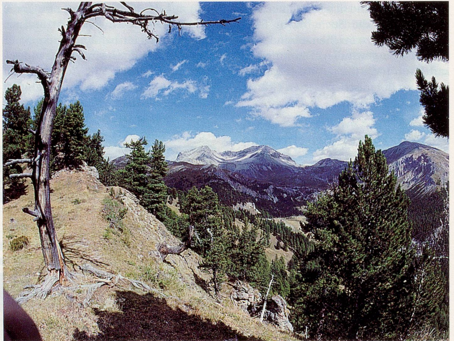
Auf der Wanderung vom Ofenpass nach Lü

D er Weg ins Münstertal, ins östlichste Tal der Schweiz, ist weit, doch die Reise lohnt sich. Und schliesslich kann man sich auf der Anreise schon bestens auf die Ferien einstellen. Die Fahrt mit den öffentlichen Verkehrsmitteln dauert zwar etwas länger, ist aber geruhsamer, lässt Zeit und Musse, die wunderschönen Landschaften zu betrachten, und mit einer Tageskarte der SBB reist man günstig. Wer ins Val Müstair kommt, sollte auf dem Ofenpass einen Halt einschal-