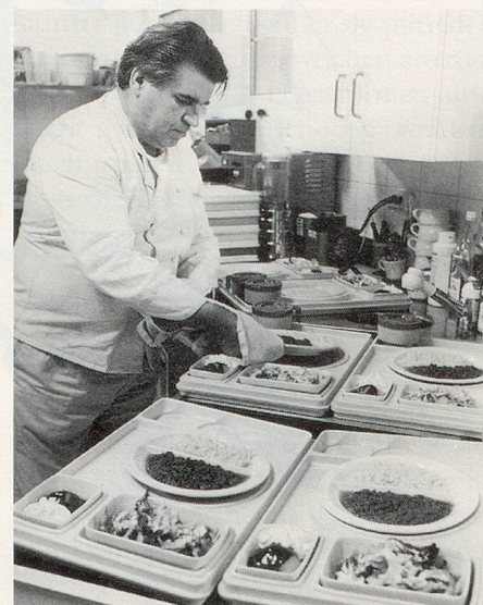
In der Küche des Kaffees Chäppelmatt werden die Menüs angerichtet.

Anfang der 90er Jahre wurde versucht, mit den Nachbargemeinden zu-