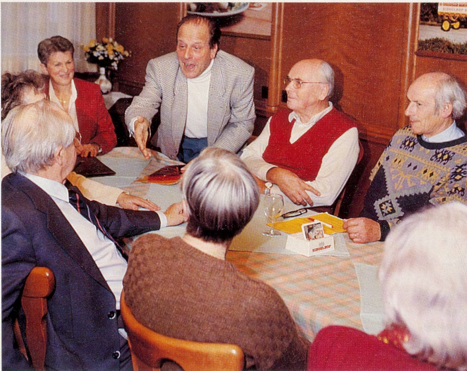
Hier reden die Alten mit: In Liestal setzen sich die Grauen Panther für rollstuhlgängige öffentliche Verkehrsmittel ein.

Immer mehr Menschen werden immer älter – daher ist Alterspolitik in den Gemeinden ein zentrales Thema. Um die richtige Infrastruktur bereitzustellen, erarbeiten interdisziplinäre Fachgremien Altersleitbilder. Aber was ist mit den Betroffenen selbst? Ist die Meinung der Alten gefragt? Haben ältere Menschen bei Altersleitbildern etwas zu sagen? Und – wollen sie sich daran beteiligen? Die Zeitlupe hat bei einigen Fachpersonen nachgefragt.