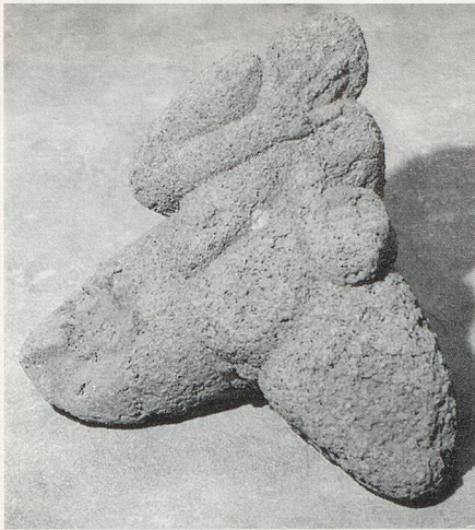
Moni Jahn: Wahl des Paris